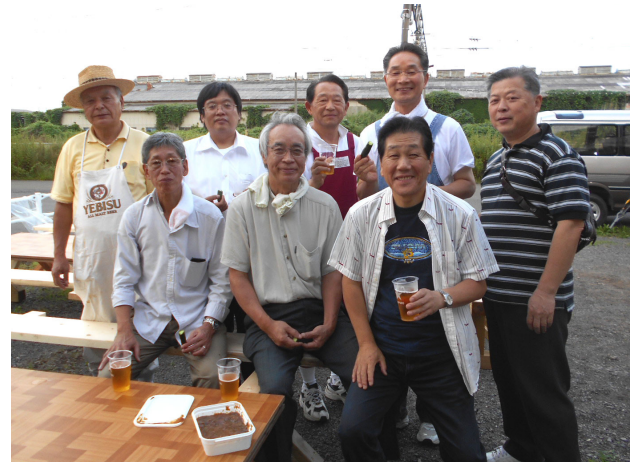
「つぼみの家」での納涼家族パーティー

お天気が心配でしたが、お陰様で無事に今年度最初の親睦活動委員会担当で、納涼家族パーティーを開催することができました。飲み物も食べ物もたっぷり用意しておりますので、皆さんどうぞごゆっくりお過ごしください。